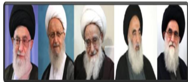
استفتاء مراجع تقلید در مورد استفاده از شبکه های اجتماعی