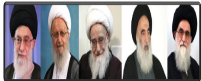
استفتاء مراجع تقلید در مورد استفاده از شبکه های اجتماعی